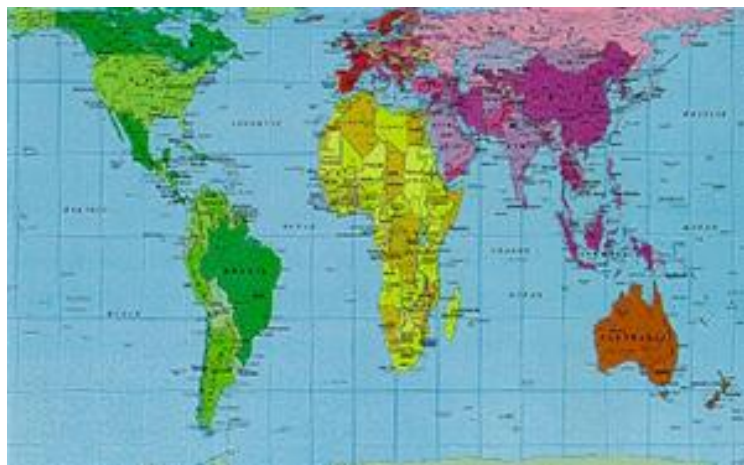
Fig. 5 - La carta di Arno Peters.

Facciamo un passo indietro. Quando in Germania nel 1974 Arno Peters convocò la conferenza stampa per annunciare al mondo la sua (nuova) rappresentazione del mondo - la proiezione ancora nota come Carta di Peters (9) (Figura 5) - il dibattito esplose. Peters affermava che la sua mappa equivalente rendeva giustizia ai paesi del mondo (e in particolare a quelli del continente africano), in quanto ne rappresentava la superficie in modo accurato, contrariamente a quanto facesse la diffusa e nota proiezione di Mercatore, da secoli colpevole di distorcere la realtà, ingrandendo a dismisura le aree del continente euro-asiatico e nord-americano. La Carta di Peters continua ad avere grandi sostenitori e accaniti detrattori. Gli uni la citano ad esempio dell'arroganza, della volontà di prevaricazione e superiorità dei paesi del Nord del mondo, colpevoli oltretutto di accettare una rappresentazione falsificata della realtà (come quella delle proiezioni di Mercatore). I detrattori sono contrari al modo in cui - a parer loro - viene strumentalizzata la Carta di Peters, che non può diventare la rappresentazione della terra, ma che deve rimanere una delle possibili rappresentazioni.