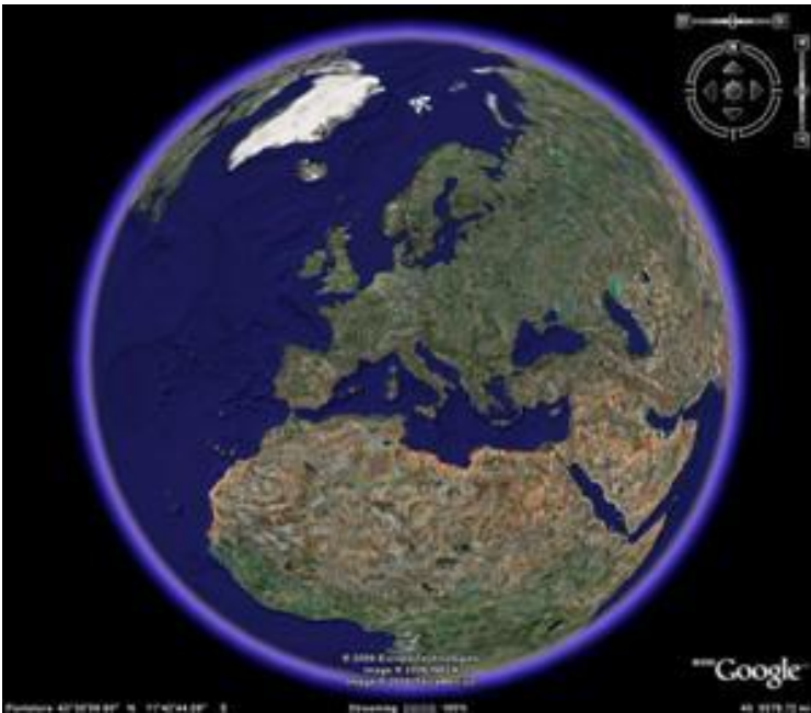
Fig. 1 - La schermata iniziale di Google Earth . Da notare che fino alla versione 3 del software l'utente - al momento dell'accesso - veniva posto di fronte agli Stati Uniti d'America, ora - con la nuova versione 4 - la posizione centrale è occupata dal paese da cui si accede (l'Italia nel nostro caso) - © Copyright 2006 Google.

L'utente ha la possibilità di osservare il pianeta da una distanza di cautela o di immergersi senza esitazione nelle terre abitate e negli oceani. Avvicinandosi alla superficie terrestre i dettagli aumentano: la risoluzione è tale da consentire la visualizzazione delle principali caratteristiche fisiche e delle opere dell'uomo; l'analisi dei segni dell'antropizzazione sul territorio (le città, i confini delle aree rurali, la presenza di dighe, ponti, etc.); i dati relativi ai confini territoriali, ai toponimi di stati, città, villaggi e regioni, etc. Per alcune zone (tipicamente gli Stati Uniti, il Canada e gli stati dell'Europa occidentale) sono disponibili ulteriori informazioni, quali le mappe stradali, la conformazione del terreno, i servizi (farmacie, ospedali, hotel, etc.) e immagini ad alta risoluzione, che rivelano i dettagli dei singoli edifici delle città principali (Figura 2).